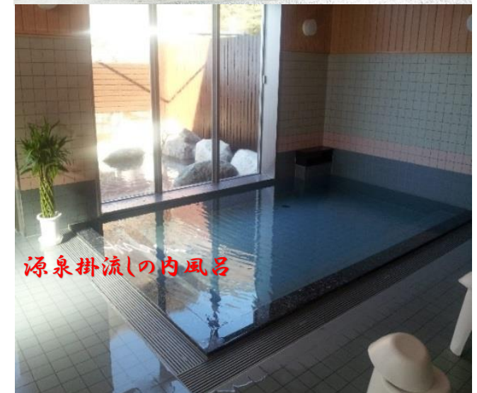
源泉掛流しの内風呂